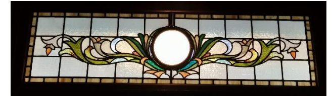
旧小川瑛五郎邸 玄関扉上 ステンドグラス 当館蔵（小川家寄贈）