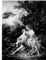
フランソワ・ブーシェ 「ユピテルとカリスト」