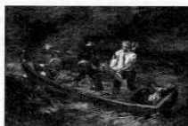
ウジェーヌ・ドラクロワ 「難破して」