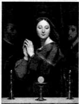
ジャン=オーギュスト= ドミニク・アングル 「聖杯の前の聖母」