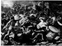
ニコラ・ブッサン 「アモリびとを打ち破るヨシュア」