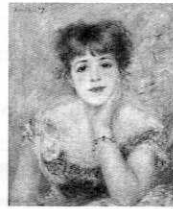
ピエール=オーギュスト・ ルノワール 「ジャンヌ・サマリーの肖像」