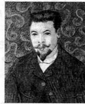
フィンセント・ ファン・ゴッホ 「医師レーの肖像」